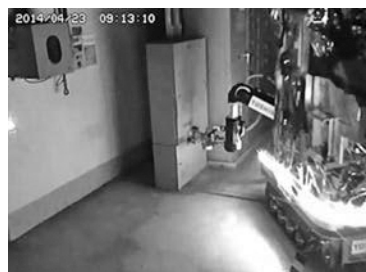
図3 実証試験の作業状況

低所用ドライアイスブラスト除染装置の開発に引き続き、高所用ドライアイスブラスト除染装置、上部階用ドライアイスブラスト除染装置の開発を実施中である。また、開発した低所用ドライアイスブラスト除染装置の実機適用により、除染作業の円滑化と廃止措置の推進に貢献することが期待される。