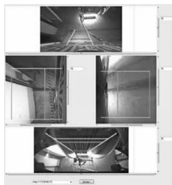
図2 除染装置周囲の俯瞰画像